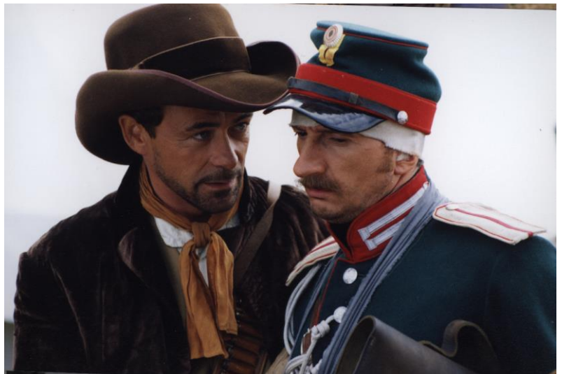
Кадр из фильма «Турецкий гамбит»

Беседовал Г. Донаров. Источник: Православие.py // http://www.pravoslavie.ru/smi/37332.htm