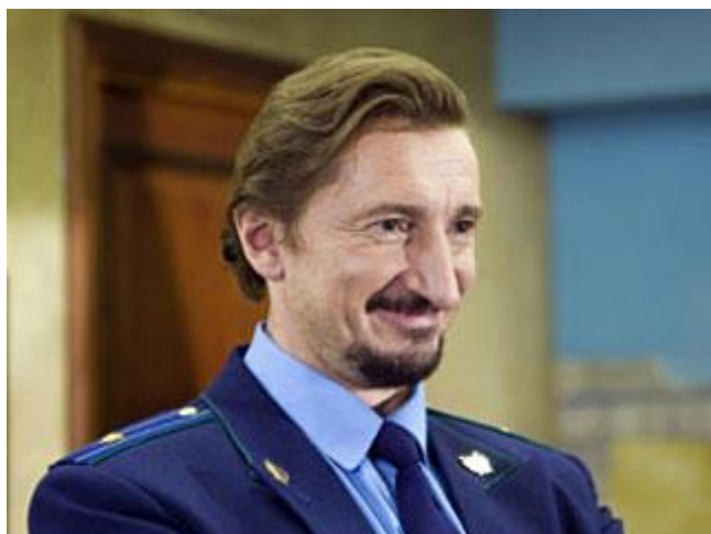
В прессе сообщалось: «Один из лучших актеров современной России Александр Лыков - снялся в новом сериале "Версия" в роли следователя прокуратуры»