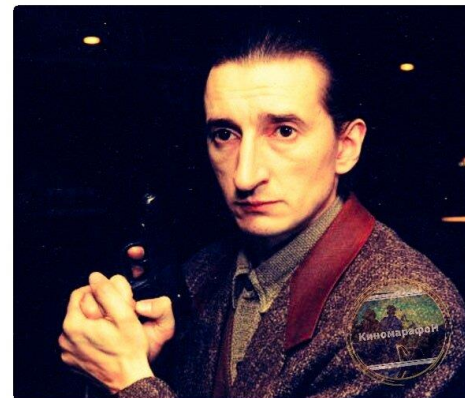
Кадр из фильма «Улицы разбитых фонарей»

— У него главный совет: «Трудись и молись». Трудись там, где тебе Господь определил. Для меня это кино, театр. Но это не значит, что ничего не изменилось. Изменилось как раз очень многое. Батюшка сказал, что мне нужно делать. Это был шаг, связанный с профессиональной деятельностью. Нужно было отказаться от одной искусительной работы. Многие, в том числе и здесь, в храме, даже из числа причта, ничего плохого в этой работе не видели, да и я сам сомневался — зачем? Но батюшка сказал — сделай. И я сделал. Ведь не для того пришёл в Церковь, чтобы продолжить своевольничать. Послушание — это когда ты не в силах понять смысл